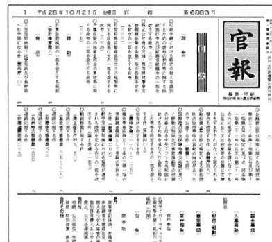
2016 年 10 月 21 日 官報本紙 第 6883 号

司法試験審査委員は法務省の「人事異動」として官報上で公告されます。 目次上は「人事異動」としか表示されないため、本文中の文言をキーワードとして検索できる官報情報検索サービス(代行検索)を使用します。 記事検索で「司法試験審査委員」と入力し検索すると、2016 年 10 月 21 日の官報本紙 第 6883 号に掲載されていることがわかり、本文の PDF を見ることができました。 司法試験審査委員は期間途中で一部変更される場合がありますが、同様に官報で確認できます。